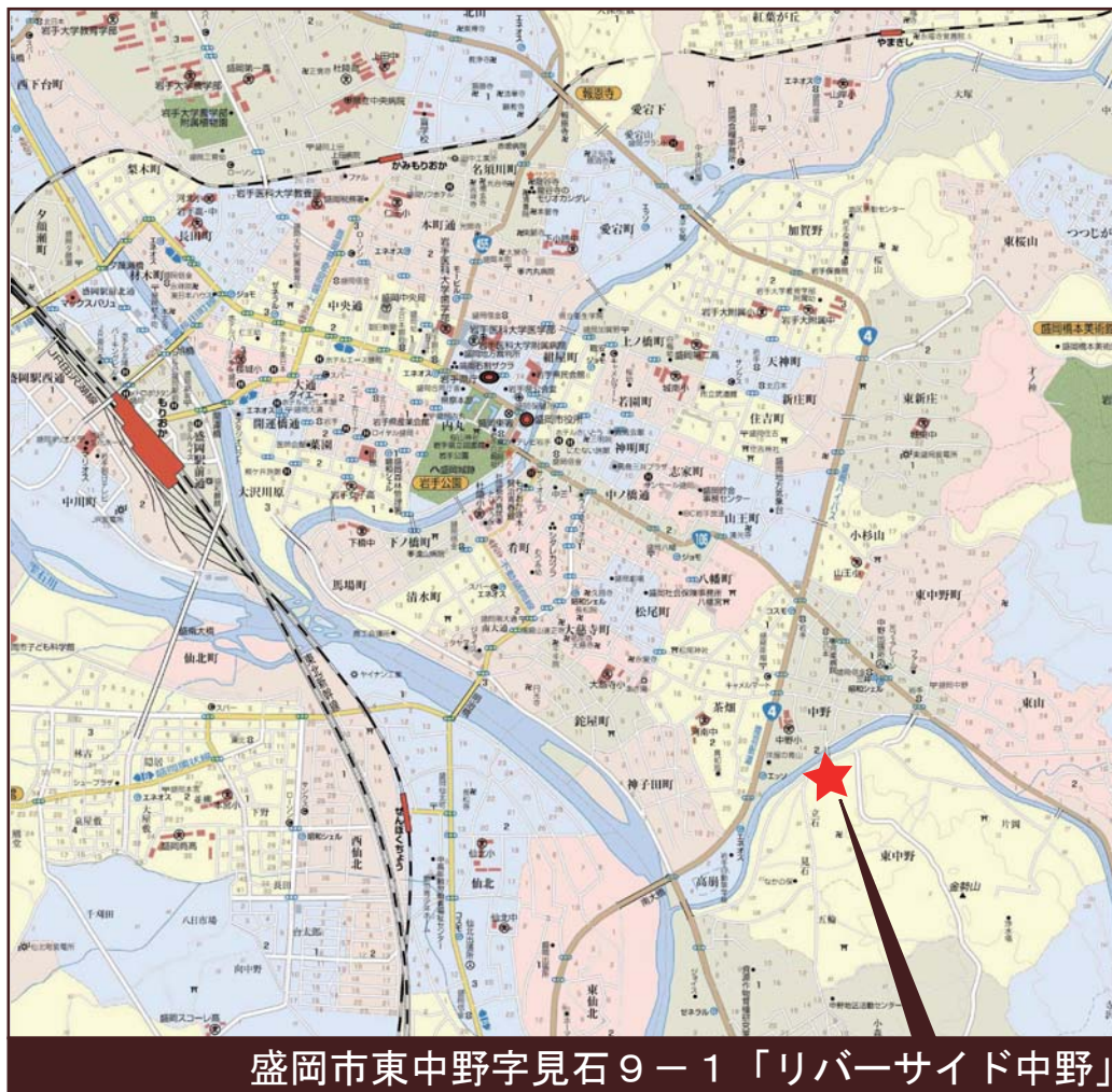
盛岡市東中野字見石9-1「リバーサイド中野」